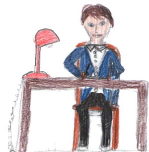
Il était comptable

Il était simple soldat et avait une vingtaine d'années, il était comptable et il a tenu un journal quotidien de la guerre, sur ce qu'il avait vécu.