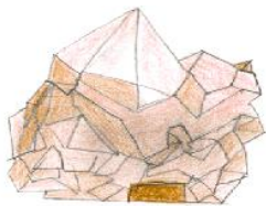
Ein Haus der Zukunft

Du wohnst in einer Stadt: Wie mag dieser Ort vor 100 Jahren ausgesehen haben und wie sieht er jetzt aus? Was soll in 100 Jahren unbedingt erhalten bleiben und warum? Wie werden die Gebäude der Zukunft aussehen? Du wohnst in einem Dorf: Wird es so etwas in 100 Jahren noch geben? Wie werden die Menschen in 100 Jahren leben, wird es noch Geschäfte geben oder wird alles per Internet erledigt? Oder wird es kein Internet mehr geben?