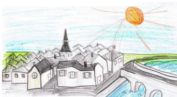
Meine Kleinstadt in 100 Jahren

Ziel: Findet heraus, was sich bis dahin verändern wird und was eurer Meinung nach in 100 Jahren in deiner Umgebung, in Deutschland und in Europa noch erhalten bleiben sollte. Erzählt es uns! Was wird die Menschen bewegen? Wie werden eure Enkelkinder oder Urenkel leben? Es können kulturelle oder auch alltägliche Ereignisse sein.