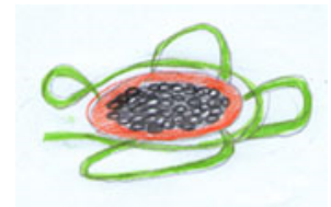
Ein Gericht in 100 Jahren

Ziel: Findet heraus, was sich bis dahin verändern wird und was eurer Meinung nach in 100 Jahren in deiner Umgebung, in Deutschland und in Europa noch erhalten bleiben sollte. Erzählt es uns! Was wird die Menschen bewegen? Wie werden eure Enkelkinder oder Urenkel leben? Es können kulturelle oder auch alltägliche Ereignisse sein.